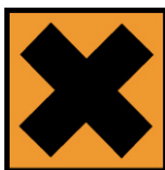
Xi - Irritant